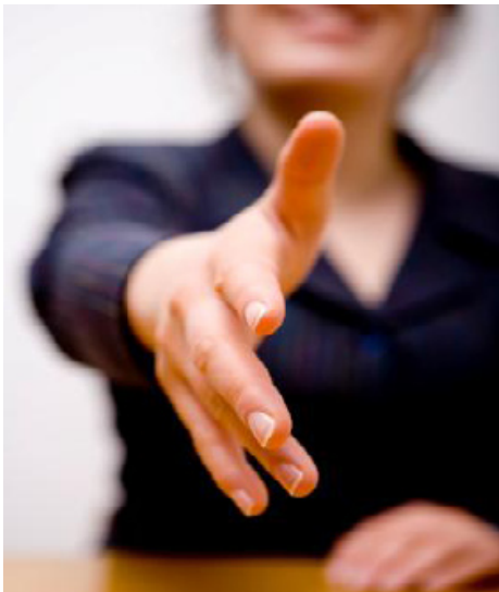
Wir begrüßen Sie herzlich in unserer Praxis!

Damit Sie bei Ihrem ersten Besuch nichts vergessen